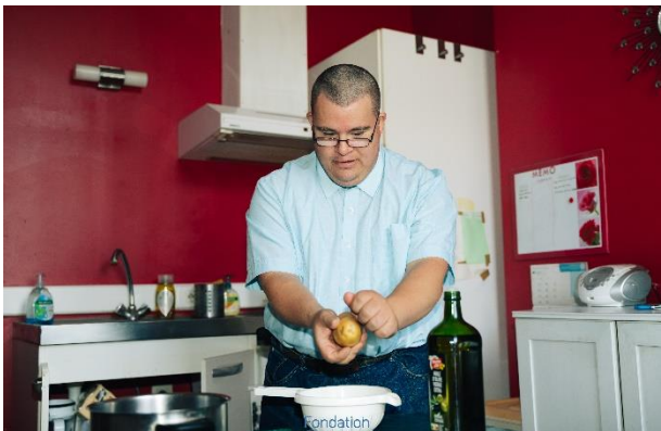
Un habitant de LA BIENVENUE à Court Saint Etienne

18 personnes en situation de handicap sont déjà locataires actifs et responsables dans un Habitat Inclusif Solidaire de la Fondation Portray.