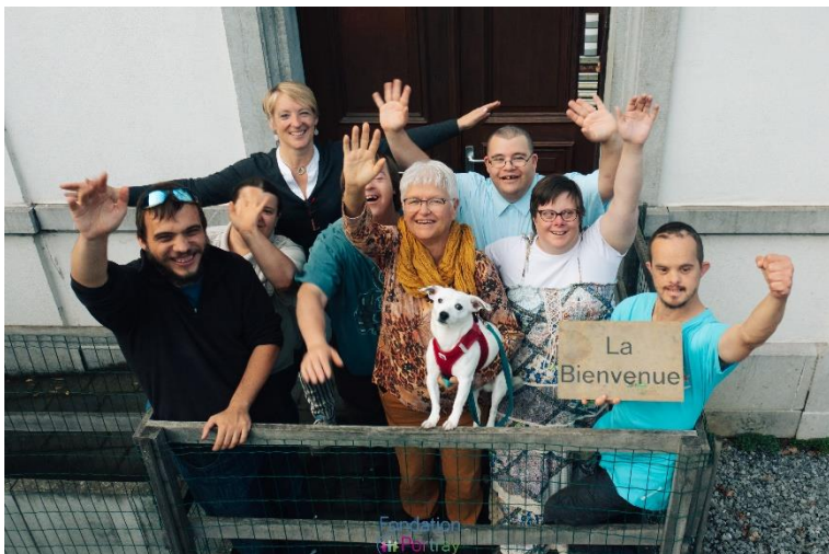
Les habitants de LA BIENVENUE à Court-Saint-Etienne, inauguré en 2014.

Les données qui objectivent cette pénurie de logements sont inexistantes faute de cadastre organisé en Belgique. Toutefois, le volume des demandes auxquelles sont confrontées la Fondation Portray et les autres acteurs du terrain associatif attestent d'une situation largement déficitaire en matière d'habitats inclusifs solidaires.