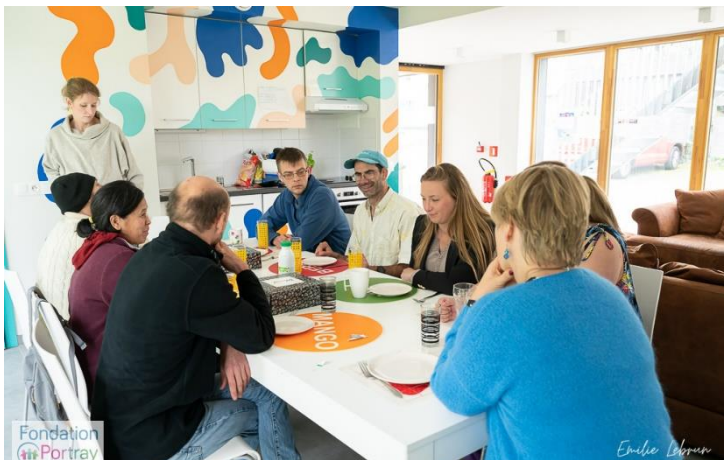
Réunion des locataires de l'habitat PERRON à Chaumont-Gistoux, inauguré en 2021

4 adultes en situation de handicap (déficience intellectuelle légère à modérée) âgés de 25 à 50 ans participent au groupe de travail sur le nouvel HIS de Marche en Famenne. Un studio sera aménagé pour un 5 ème habitant, volontaire de l'asbl Les Compagnons Bâtisseurs basée à Marche en Famenne. Cette mixité garanti l'ouverture du projet sur le monde extérieur.